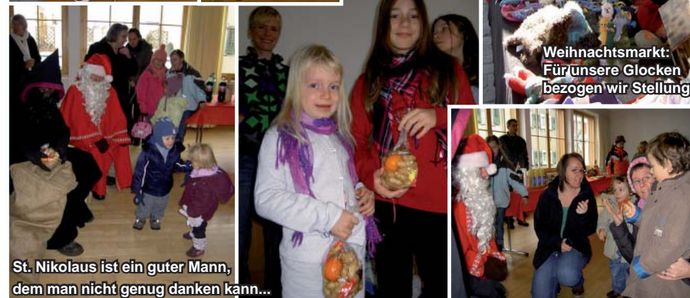
St. Nikolaus ist ein guter Mann, dem man nicht genug danken kann...