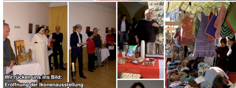
Wir rücken uns ins Bild: Eröffnung der Ikonenausstellung