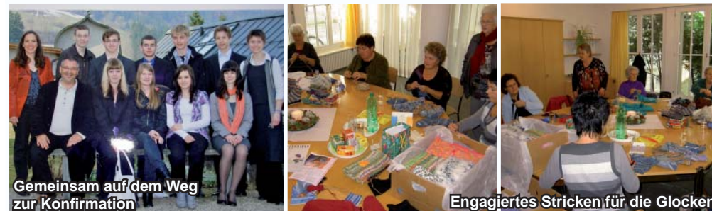
Gemeinsam auf dem Weg zur Konfirmation